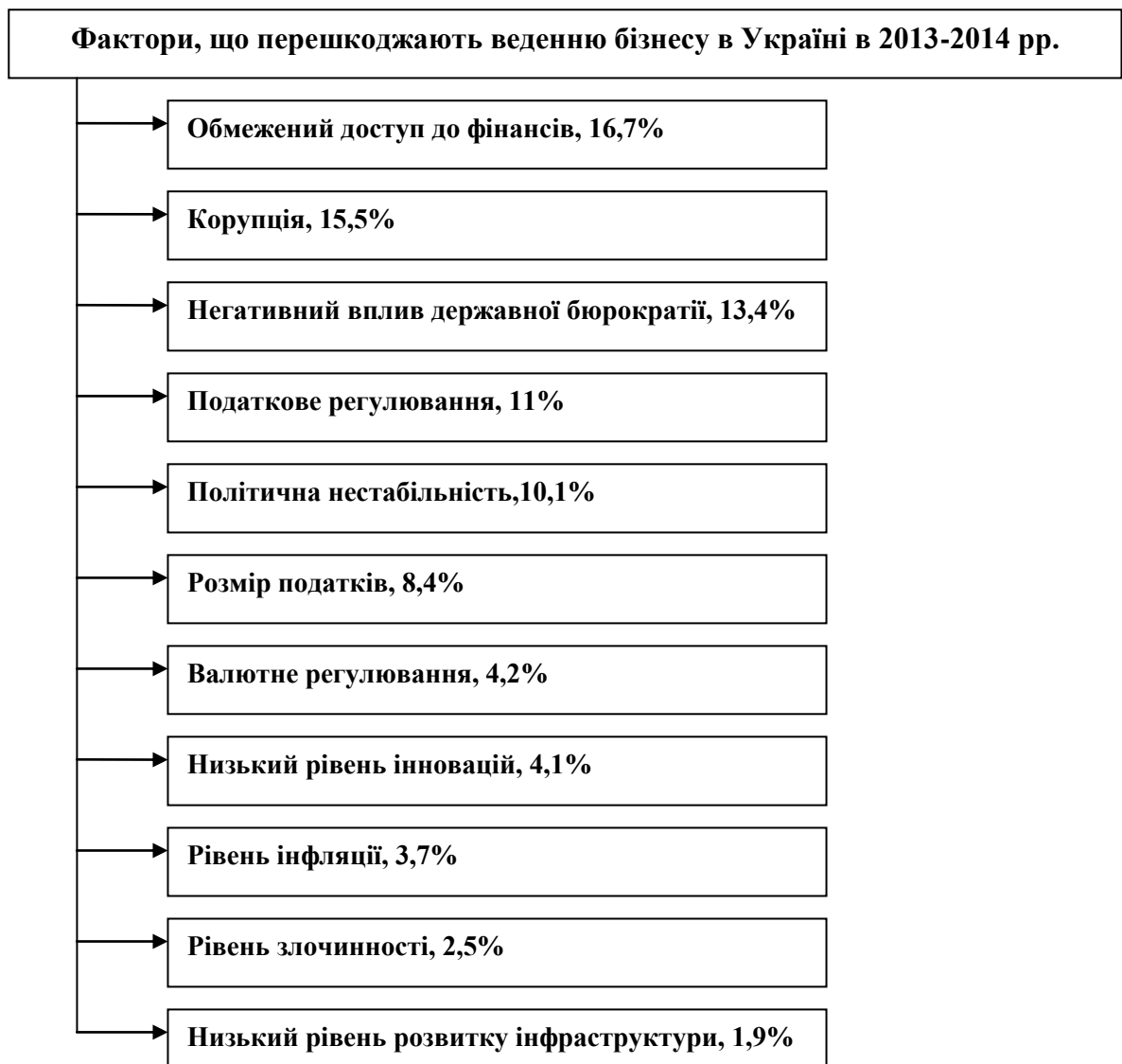
Рис. 2. Проблемні фактори ведення бізнесу в Україні 2013-2014 рр. [6]

Найбільшого впливу сфера бізнесу зазнає з боку бюрократії, корупції, податкової політики, відсутня довіра до політиків, правоохоронних органів та судочинства. І на стримування цих негативних факторів має спрямовуватись державна політика допомоги підприємству.