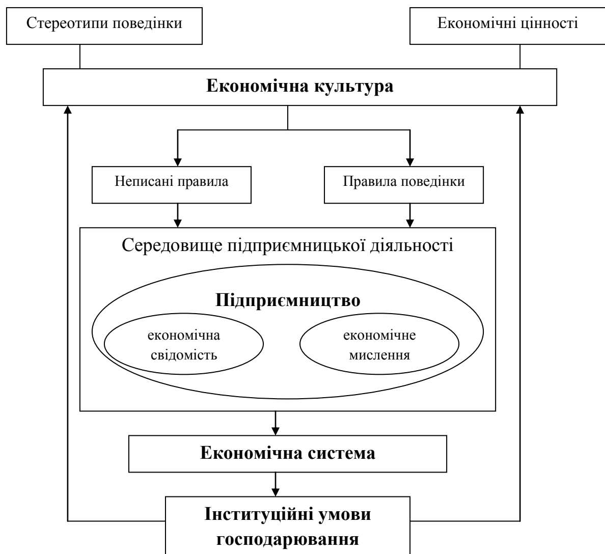
Рис.1.3. Вплив економічної культури на підприємницьку діяльність*

економічну культуру. За влучним визначення Ю.Райта, економічна культура, як невід’ємний елемент культури народу, є надбанням господарської діяльності попередніх поколінь [8, с.400]. Економічна культура поєднує в собі економічні цінності (знання, навички, способи і форми господарювання) і стереотипи поведінки суб’єктів економічної (підприємницької) діяльності. Вона значною мірою визначає характер формальних інститутів, які створюються під впливом неформальних інститутів і формують середовище підприємницької діяльності (Рис.1.3).