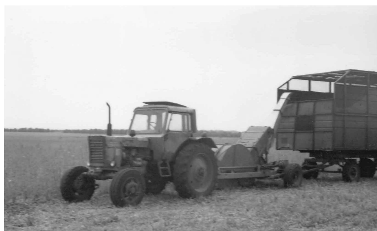
Рис. 1. Технологічна схема (а) і загальний вид (б) причіпної збиральної машини