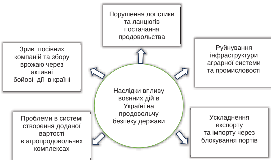
Рис. 2. Наслідки негативного впливу воєнних дій в Україні на продовольчу безпеку держави

Продовольча безпека для України в найближчій перспективі є одночасно політичним та соціально-економічним пріоритетом і викликом. Стратегічні заходи для забезпечення довготривалої продовольчої безпеки та зміцнення ролі України в глобальних зусиллях