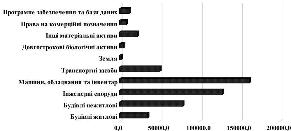
Рис. 2. Капітальні інвестиції за видами активів у 2020 році, тис. грн

Водночас процес залучення капітальних інвестицій в економіку України суттєво загальмований впливом політичної та економічної криз останніх років. Унаслідок цього активізувались інфляційні процеси, знизився інвестиційний потенціал державного бюджету, погіршився фінансовий стан підприємств, зріс відплив банківських депозитів, збільшилась кількість збиткових фінансово-кредитних установ, скоротились обсяги банківського кредитування підприємств, знизилась інвестиційна