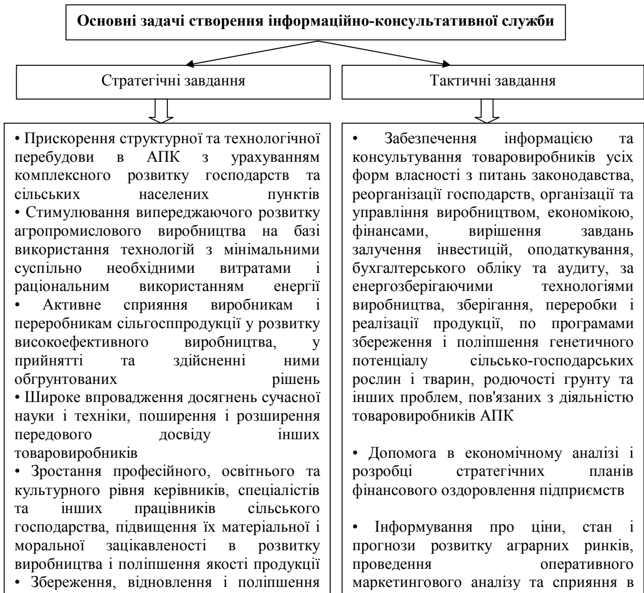
Рис. 1. Стратегічні і тактичні задачі по створенню інформаційно-консультативної служби в АПК Вінницької області

Використання даної технології, з урахуванням світових тенденцій розвитку консалтингу, дозволить регіональній інформаційно-консультаційній службі сприяти реалізації стратегічних напрямів розвитку районів та області.