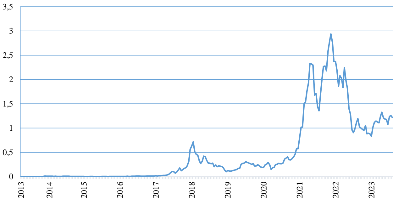
Рис. 1. Загальна ринкова капіталізація всіх криптовалют за період від 30.04.2013 р. до 31.07.2023 р., трлн дол. США

Ринок криптовалют функціонує, розвивається і демонструє загальний тренд до зростання з 2008 року. За даними CoinMarketCap [17], максимального рівня капіталізації (близько 3 трлн дол. США) світовий крипторинку досяг у листопаді 2021 року, що є співставним із ринковою вартістю таких технологічних гігантів, як Apple й Microsoft (рис. 1).