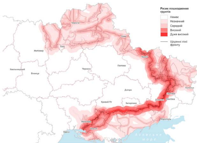
Рис. 1. Ризики пошкодження ґрунтів у зонах бойових дій

Вагомими є руйнування елеваторів для зберігання зерна. За рік війни сумарна ємність зруйнованих зерносховищ склала 8,2 млн т готової зернової продукції, а пошкодження ємностей зерносховищ сягає 3,25 млн т потужностей одночасного зберігання зерна. Прогнозна сумарна вартість відновлення зруйнованих потужностей визначається в розмірі 1,33 млрд дол. Однак внаслідок ракетних обстрілів інфраструктури портів, розташованих на побережжі Чорного моря, такі витрати суттєво зросли.