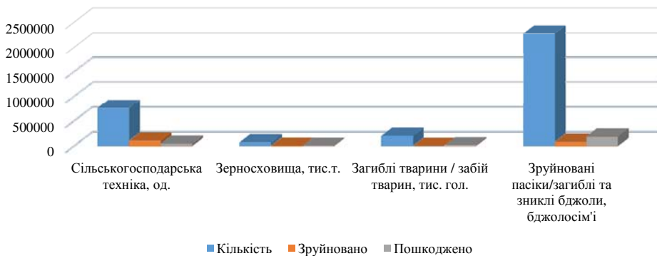
Рис. 2. Оцінка прямих втрат АПК та земельних ресурсів внаслідок війни

Загальна сума прямих збитків, завданих агропромисловому комплексу України за рік повномасштабного вторгнення, становить 8,7 млрд дол. США. Реальна оцінка прямих втрат АПК та земельних ресурсів внаслідок війни представлена у графіку (рис. 2):