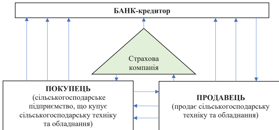
Рис. 4. Етапи кредитування сільськогосподарських підприємств банками