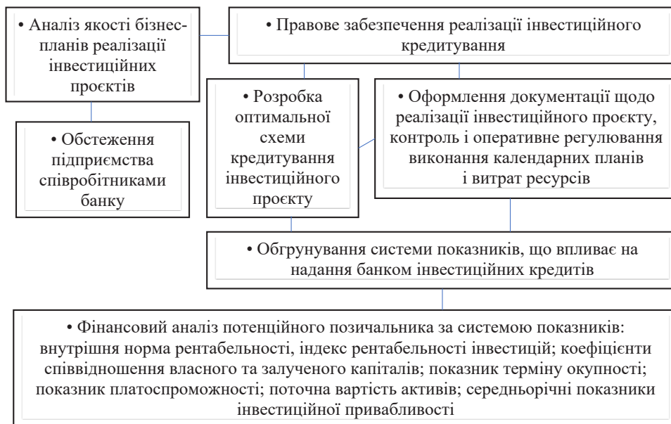
Рис. 2. Схема взаємозв'язку окремих елементів механізму кредитування інвестиційних проєктів

4. Розширення виробництва. Завдяки доступу до кредитів сільськогосподарські підприємства можуть розширювати свої виробничі масштаби, збільшувати площу оброблюваної землі, збагачувати агротехнічні культури та розширювати асортимент продукції. Це дозволяє збільшити обсяги виробництва та покращити економічні показники підприємства.