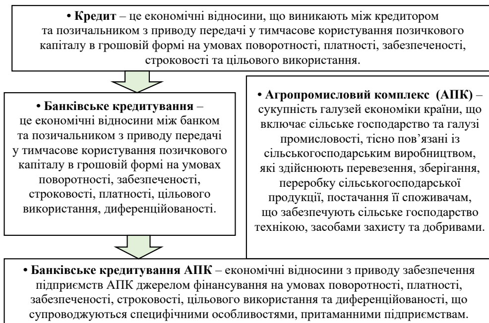
Рис. 1. Визначення поняття «банківське кредитування АПК»

Відсутність низькодохідної кредитної програми або підтримки з боку держави може бути проблемою для аграрного сектора; високий рівень ризику, адже сільське господарство має свої особливості і ризики, такі як залежність від погодних умов і ринкової нестабільності. Це може спричинити сумніви у банків щодо надання