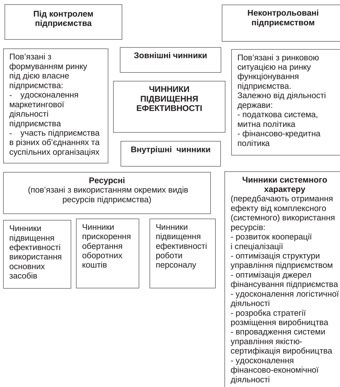
Рис. 2. Класифікація чинників підвищення ефективності діяльності підприємства