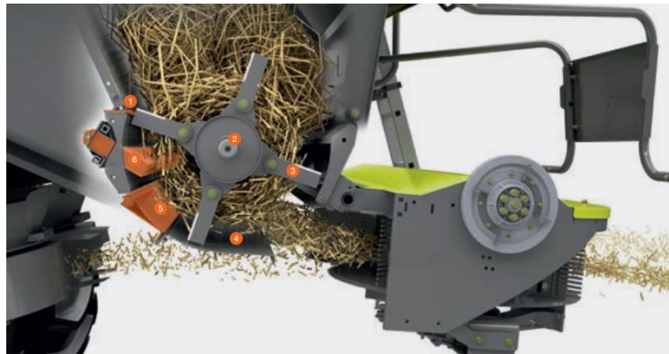
Рис. 4. Загальний вигляд подрібнювача соломи: 1 – регульований поперечний ніж; 2 – роторний вал; 3 – ножі; 4 – розтиральна планка; 5 – регульоване днище; 6 – регульований протирізі

зношуванні ножів соломиста маса, що сходить із роторів системи сепарації не повністю подрібнюється, і в результаті чого накопичується у просторі між роторним валом подрібнювача соломи і викидними вікнами роторів, цим самим створює умови непрохідності соломистої маси за межі подрібнювача соломи (Рис. 4).