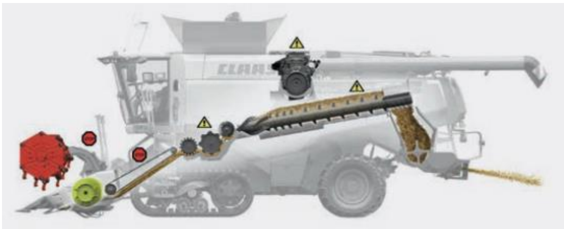
Рис. 2. Схема рівномірного руху хлібної маси через робочі органи зернозбирального комбайна

За основу досліджень взято зернозбиральний комбайн Claas Lexion 750, оскільки він декілька сезонів працював на дослідних полях господарства Закладу вищої освіти «Подільський державний університет».