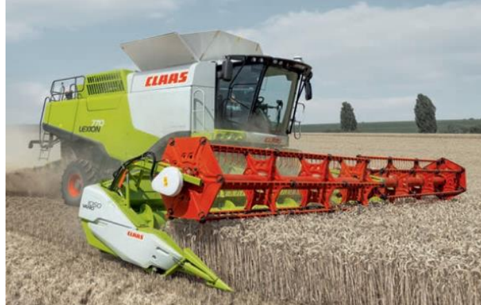
Рис. 1. Загальний вигляд комбайна CLAAS LEXION

Моделювання складної технічної системи, що враховує технологічні особливості функціонування в різних умовах використання дозволяє визначити внутрішні джерела підвищення продуктивності зернозбирального комбайна (Рис. 1).