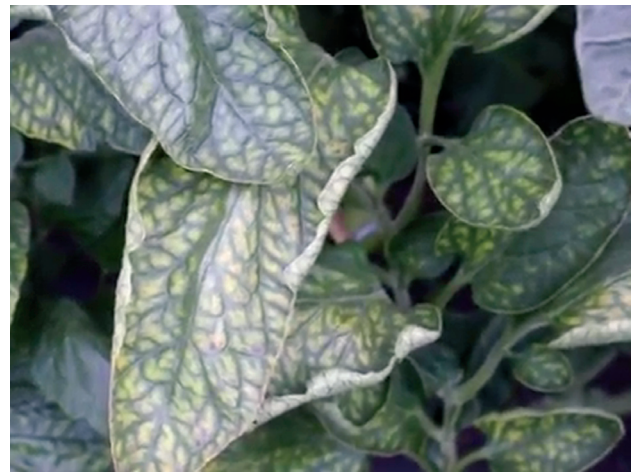
Рис. 2. Хлороз у томатів

На сильнокислих ґрунтах у деяких рослин проявляються симптоми токсичності (надлишку) магнію. Подібну реакцію можна спостерігати в картоплі, буряка, яблуні та інших рослин. При надмірному надходженні цього елемента листки злегка темніють і незначно зменшуються.