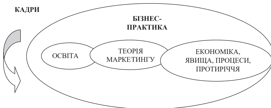
Рис. 1. Світовий досвід становлення маркетингу