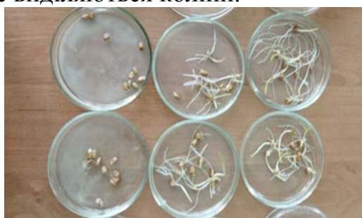
Рис. 1. Результати впливу водорозчинних речовин із кореневищ пирію повзучого ( Elytrigia repens L.) на схожість насіння пшениці (зверху донизу й зліва направо концентрації 1:10; 1:20; 1:50; 1:100; 1:1000 та контроль).

Це узгоджується із літературними даними, які вказують на те, що алелопатична дія колінів залежить від рівня концентрації наряду із іншими чинниками. Також це пояснює наявність протиріч в інформації, що стосується фітонцидного впливу між рослинами. Варто враховувати й зміни в хімічному складі рослин впродовж вегетаційного періоду. Причому не лише наявність чи відсутність певних речовин, але й відсоткове співвідношення їх всередині рослини, активність метаболічних процесів та характеристики середовища в яке виділяються коліни.