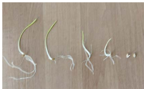
Рис. 2. Типові представники кожного із вищезазначених варіантів (від контрольного варіанту в порядку зростання концентрації водних витяжок).