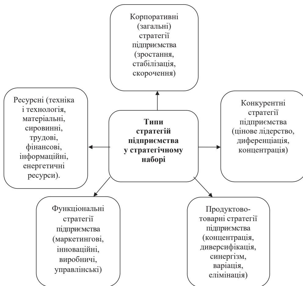
Рис. 1. Типи стратегій підприємства у стратегічному наборі

Ефективна і чітко визначена економічна стратегія визначає підприємство сильним і стійким конкурен-