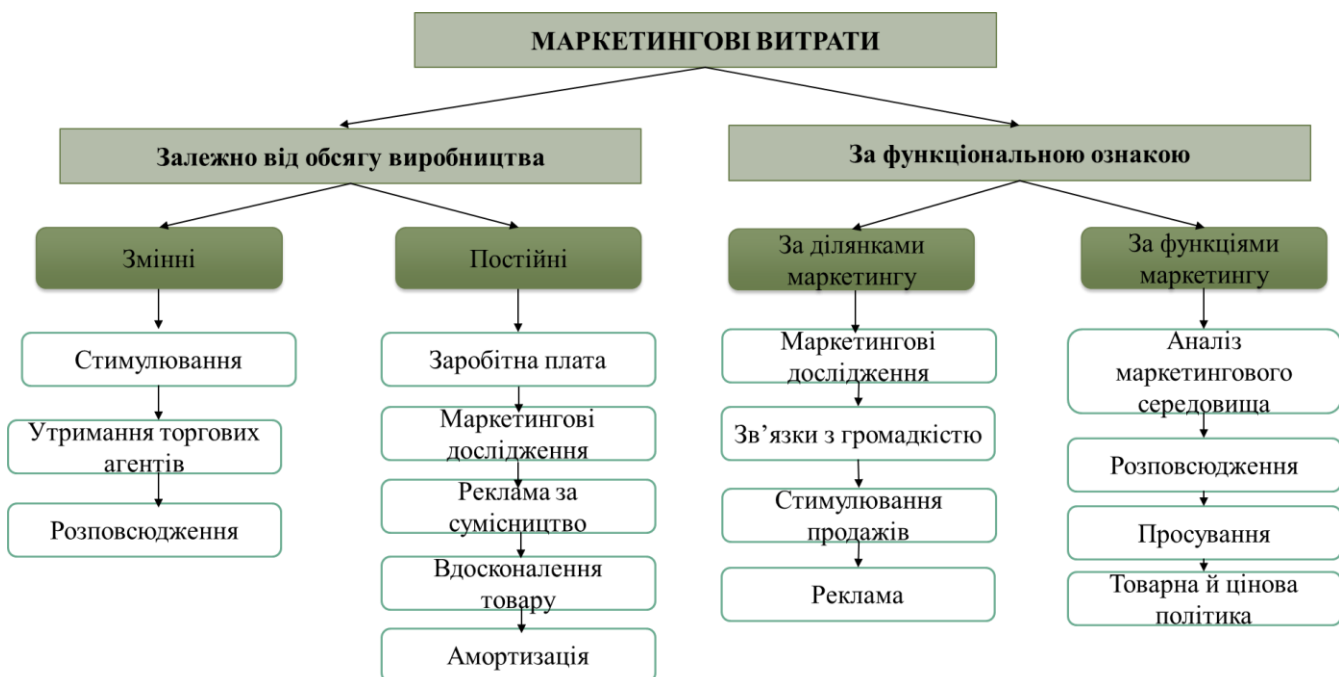
Рисунок 2 – Класифікація маркетингових витрат на підприємствах садівництва

Класифікація за функціональною ознакою дозволить організувати управління витратами за центрами відповідальності та визначити пріоритетні напрями розвитку маркетингової діяльності (рис. 2).