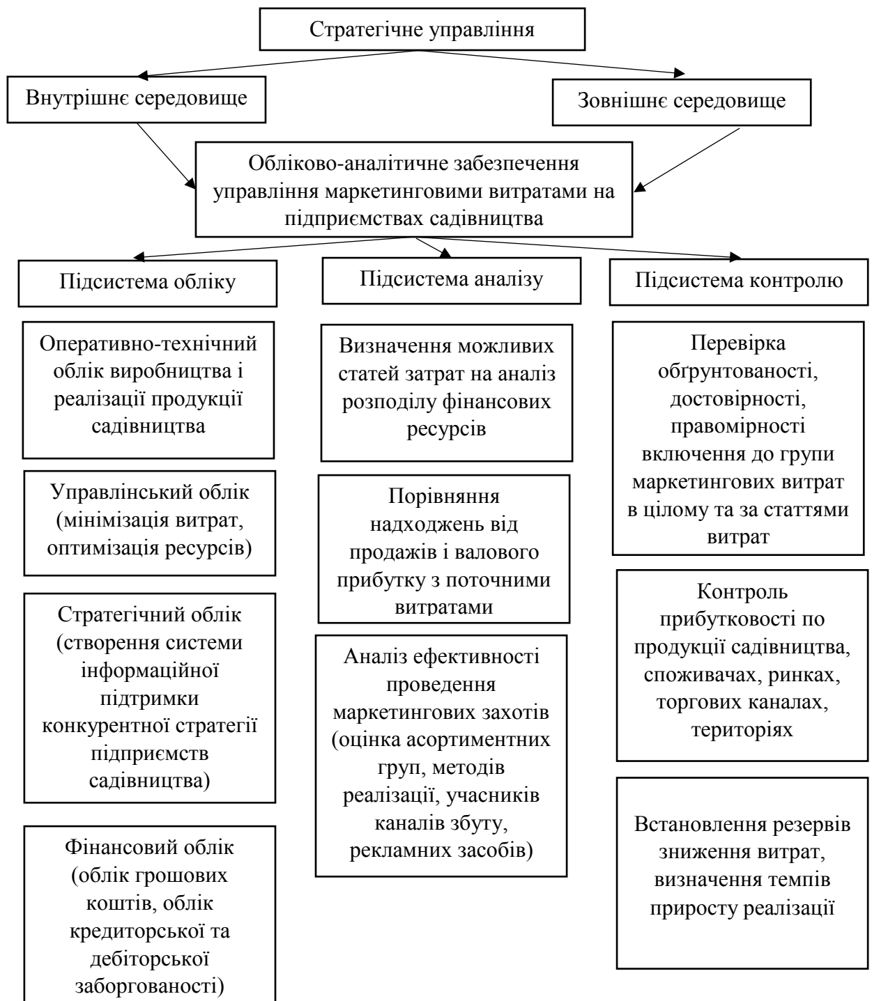
Рисунок 1 – Система обліково-аналітичного забезпечення управління маркетинговими витратами на підприємствах галузі садівництва

Система виконує інформаційну, облікову, аналітичну та контрольну функції, що забезпечують досягнення мети: надання інформаційної підтримки у прийнятті управлінських рішень; аналіз та оцінка ефективності рішень щодо управління витратами та підприємством в цілому (рис. 1) [3, с. 37].