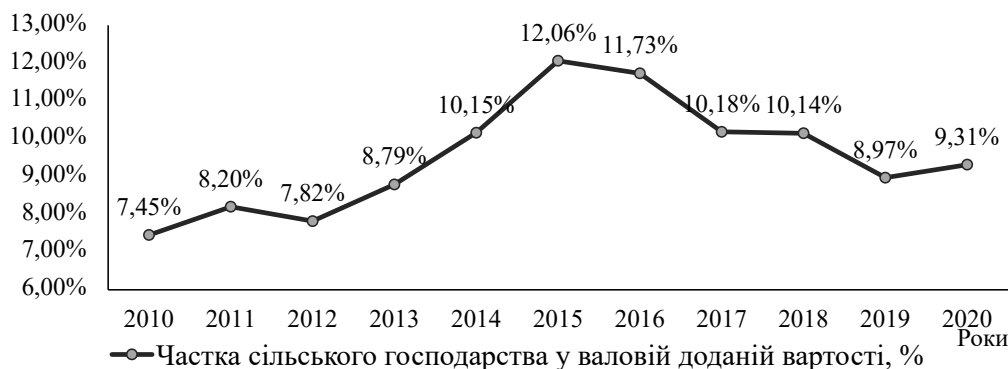
Рис. 3. Динаміка частки сільського господарства у ВВП України у 2010–2020 роках