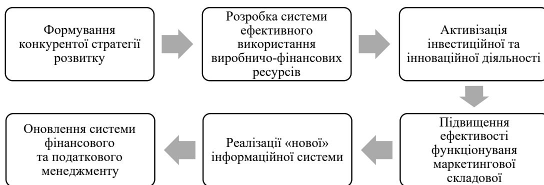
Рис. 5. Організаційно-економічний механізм управління конкурентоспроможністю підприємства