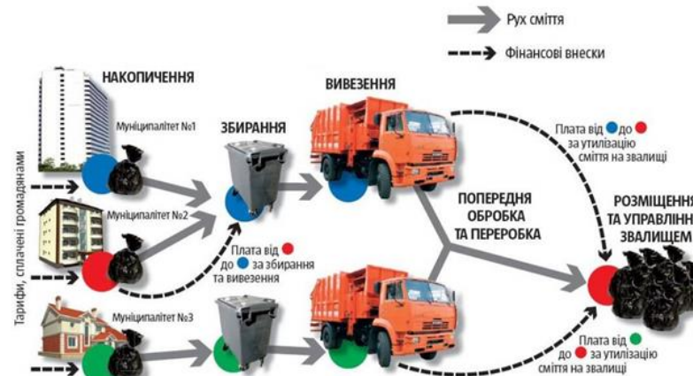
Рис. 2. Логістична схема поводження з ТПВ у Швейцарії та Німеччині

Споживчу цінність твердих побутових відходів можна частково або повністю втратити через проблеми в логістиці (неправильне зберігання, неякісну доставку). У Європі лідерами із запровадження ефективних логістичних схем щодо рециклінгу твердих побутових відходів є Швейцарія, Німеччина й Велика Британія. Під час їхньої реалізації співпрацюють, як правило, декілька муніципалітетів, які забезпечують роздільне збирання та вивезення відходів для сортування та подальшого ефективного управління ними (рис. 2).