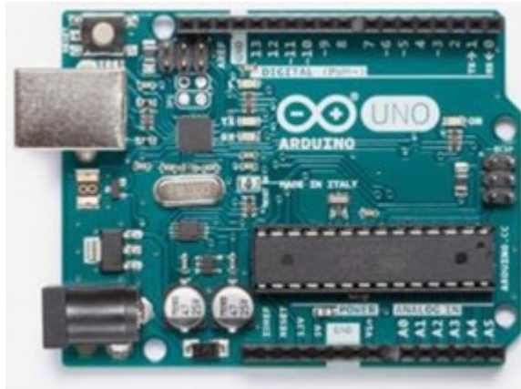
Рис. 1. Загальний вигляд плати Arduino Uno