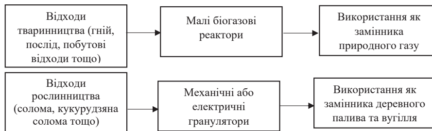
Рисунок 1 – Принципова схема переробки відходів сільськогосподарської діяльності в особистих селянських господарств на біогаз та тверде біопаливо

Доцільним також є розвиток енергокооперативів орієнтованих на виробництво пелет для власних потреб учасників (особистих селянських господарств). Результатом створення енергетичних кооперативів буде збільшення частки обслуговуючих кооперативів та їхніх об'єднань; менші витрати в розрахунку на