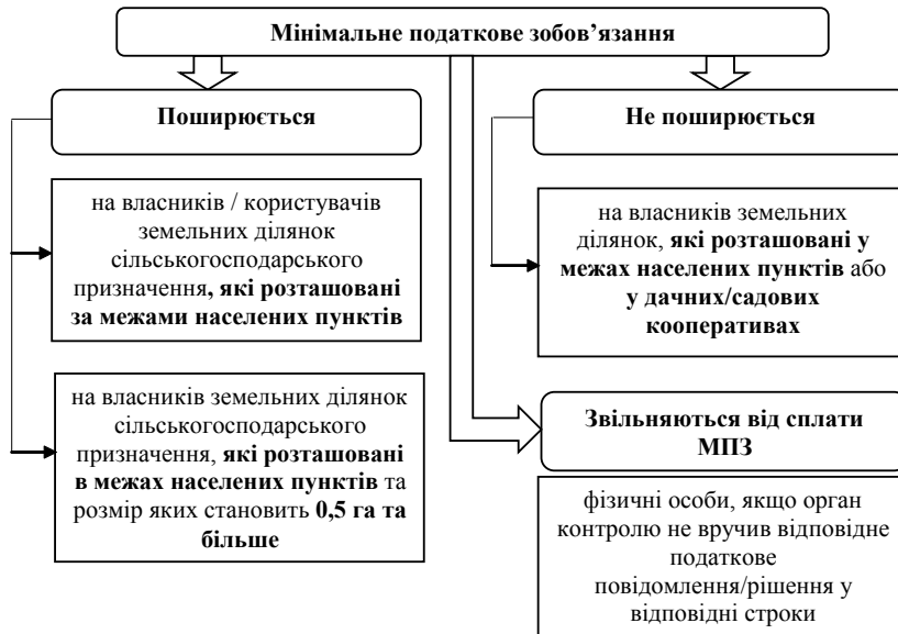
Рис. 2. Застосування мінімального податкового зобов'язання