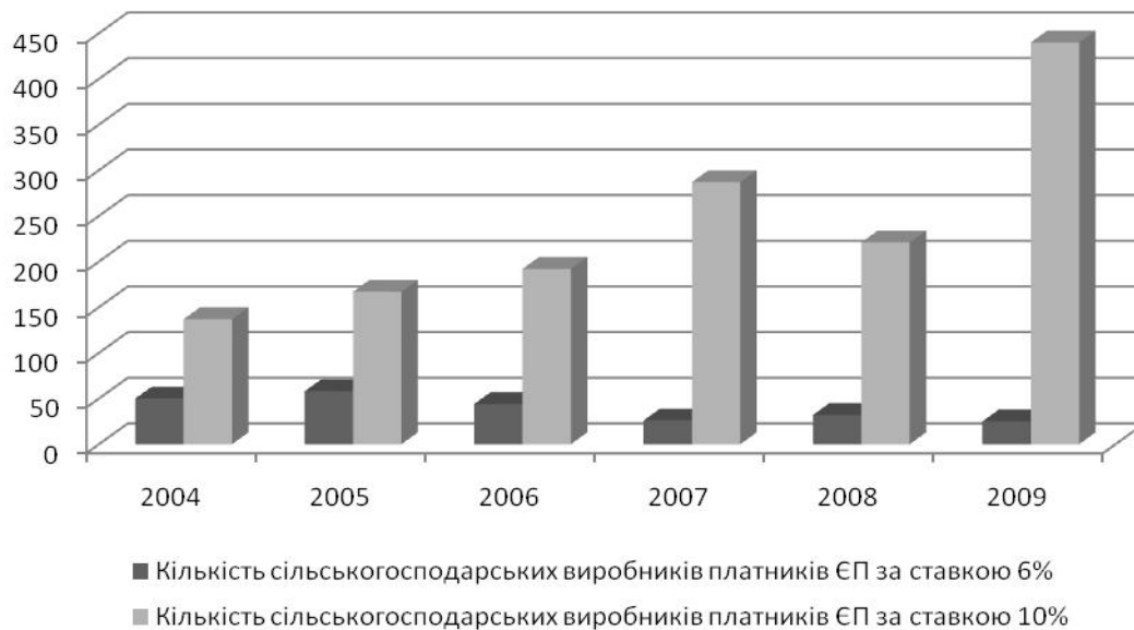
Рис. 1. Динаміка реєстрації платників єдиного податку за ставками 6% і 10 % в сільському господарстві Хмельницької області у 2004-2009 рр.

Останнє підтверджується й величиною нарахованого податку суб'єктами малого підприємництва галузі відносно валової доданої вартості (ВДВ) сільського господарства та загалом, виробленій у Хмельницької області. Адже як очевидно з даних табл. 1, у цих роках його частка знаходилась у середньому на рівні відповідно 0,05 % та 0,01 % до зазначених статистичних показників області.