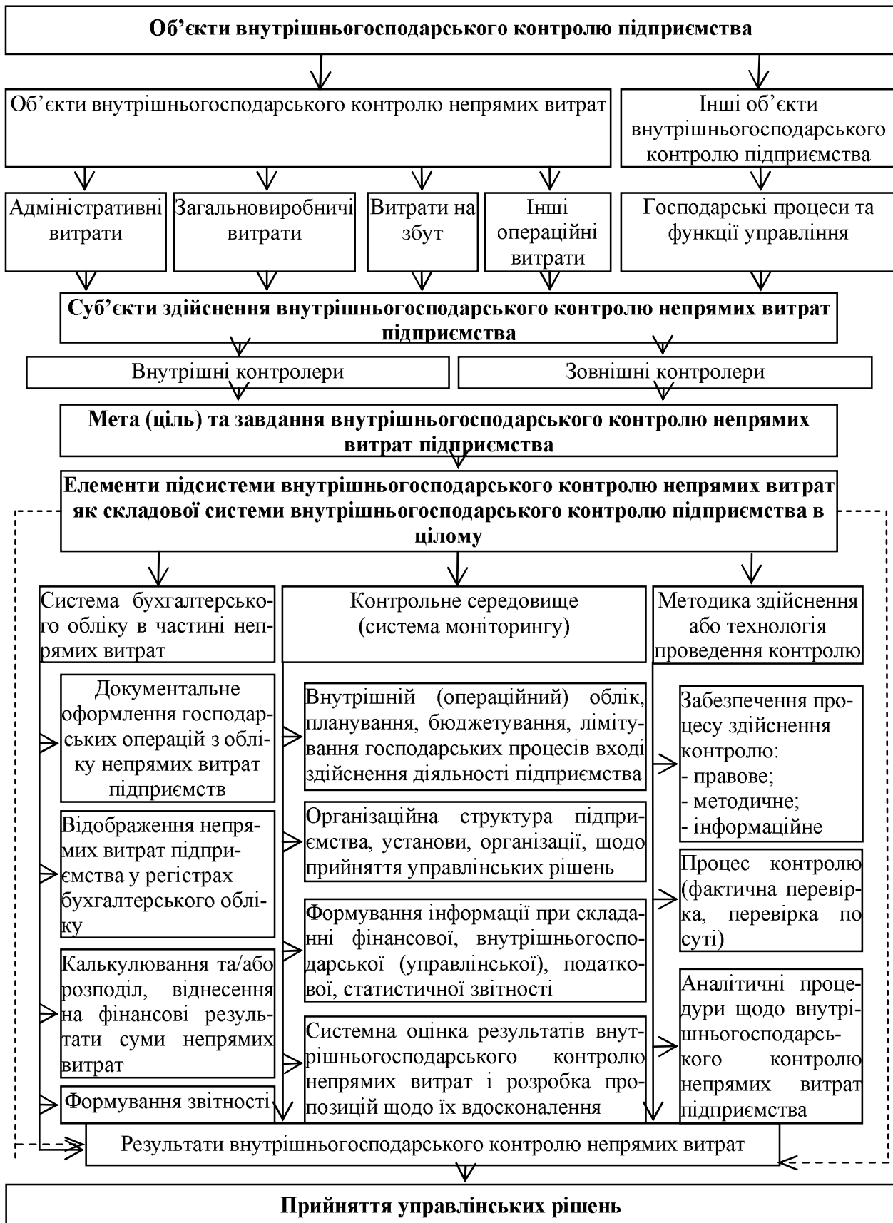
Рис. 1. Модель підсистеми внутрішньогосподарського контролю непрямих витрат як складової системи внутрішньогосподарського контролю підприємства в цілому