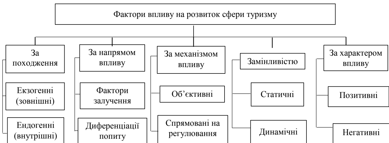
Рисунок 2 – Систематизована структура факторів впливу на розвиток сфери туризму

З погляду мінливості автор вбачає доцільним поділити фактори на статичні і динамічні. Статичні фактори мають незмінне в часі значення (природно-кліматичні, географічні, культурно-історичні фактори). До динамічних факторів автором віднесено: демографічні (загальне зростання народонаселення, урбанізація, тобто збільшення частки міського населення за рахунок скорочення чисельності сільських жителів, зміна вікової структури населення); соціальні (зростання добробуту населення, збільшення тривалості оплачуваних відпусток і скорочення тривалості робочого тижня, збільшення числа працюючих жінок і збільшення доходу на кожну сім'ю (домогосподарство), зростання частки самотніх людей, тенденція до більш пізнього шлюбу і створення сім'ї, надзвичайно швидке зростання кількості бездітних пар у складі населення, зменшення імміграції, більш ранній вихід на пенсію, зростання усвідомлення туристських можливостей); економічні, які впливають на структуру споживання товарів і послуг у бік збільшення в споживчому кошику населення частки різних послуг, у тому числі і туристичних; культурні (зростання культурного рівня населення багатьох країн і в зв'язку з цим прагнення людей до ознайомлення із зарубіжними культурними цінностями); науково-технічний прогрес, який зумовлює швидкий розвиток матеріально-технічної бази туристичної індустрії, створює необхідні умови для масового туризму.