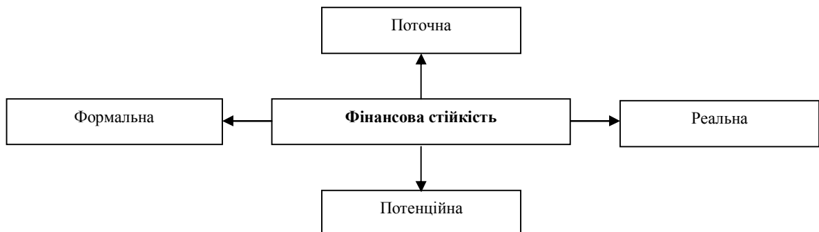
Рис. 3. Види фінансової стійкості підприємства