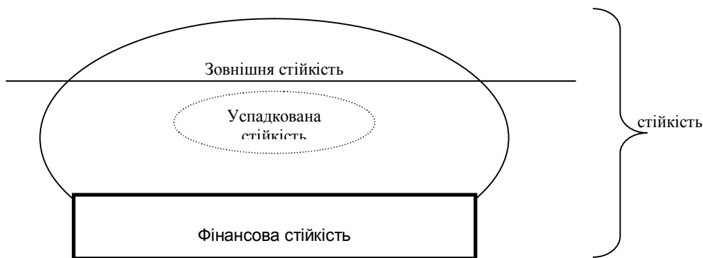
Рис. 1. Комплексне визначення категорії стійкості підприємства [1]

Головною складовою загальної стійкості підприємства є фінансова стійкість, яка формується в процесі всієї його фінансово-господарської діяльності.