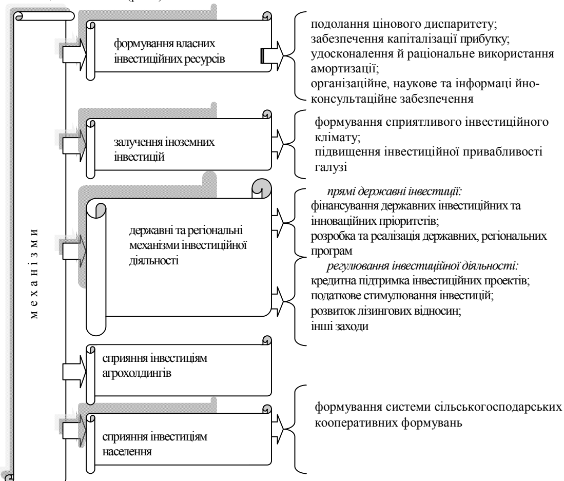
Рис.2. Механізми інвестиційного забезпечення аграрного виробництва