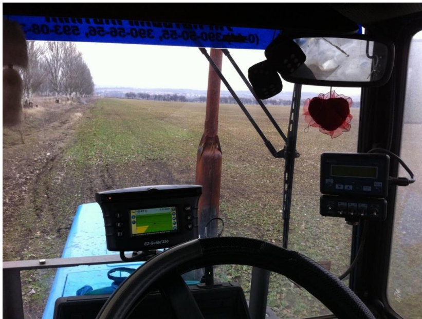
Рис. 2. Робота в полі експериментальним машинно-тракторним агрегатом

Було проведено експериментальні дослідження для покращення якісних показників відцентрових розкидачів, нами було виготовлено дослідний зразок роторного робочого органу діаметром 600 мм і взято еталонний диск. Дослідження проводились в ТОВ «Чемпіон» Павлоградського району Дніпропетровської області.