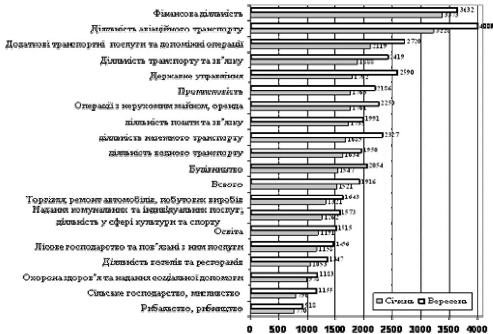
Рис.3. Середньомісячна заробітна плата за видами економічної діяльності у 2008 р., грн.

Висновки. На даному етапі інвестування в людський капітал на є недостатнім. На це впливає низка чинників, зокрема це мала зайнятість, недостатня зарплата та висока процентна ставка. Людський капітал – це визначальний капітал, який викликає до життя всі інші капітали, формує їх, забезпечує їх ефективне функціонування та соціально-економічну результативність. Людський капітал – це джерело економічного зростання, не менш важливе, ніж капіталовкладення в матеріально-речові фактори виробництва та землю. Якщо українське не зуміє усвідомлено та цілеспрямовано вкладати інвестиції в розвиток людини, воно, безперечно буде відставати в економічному розвитку від інших.