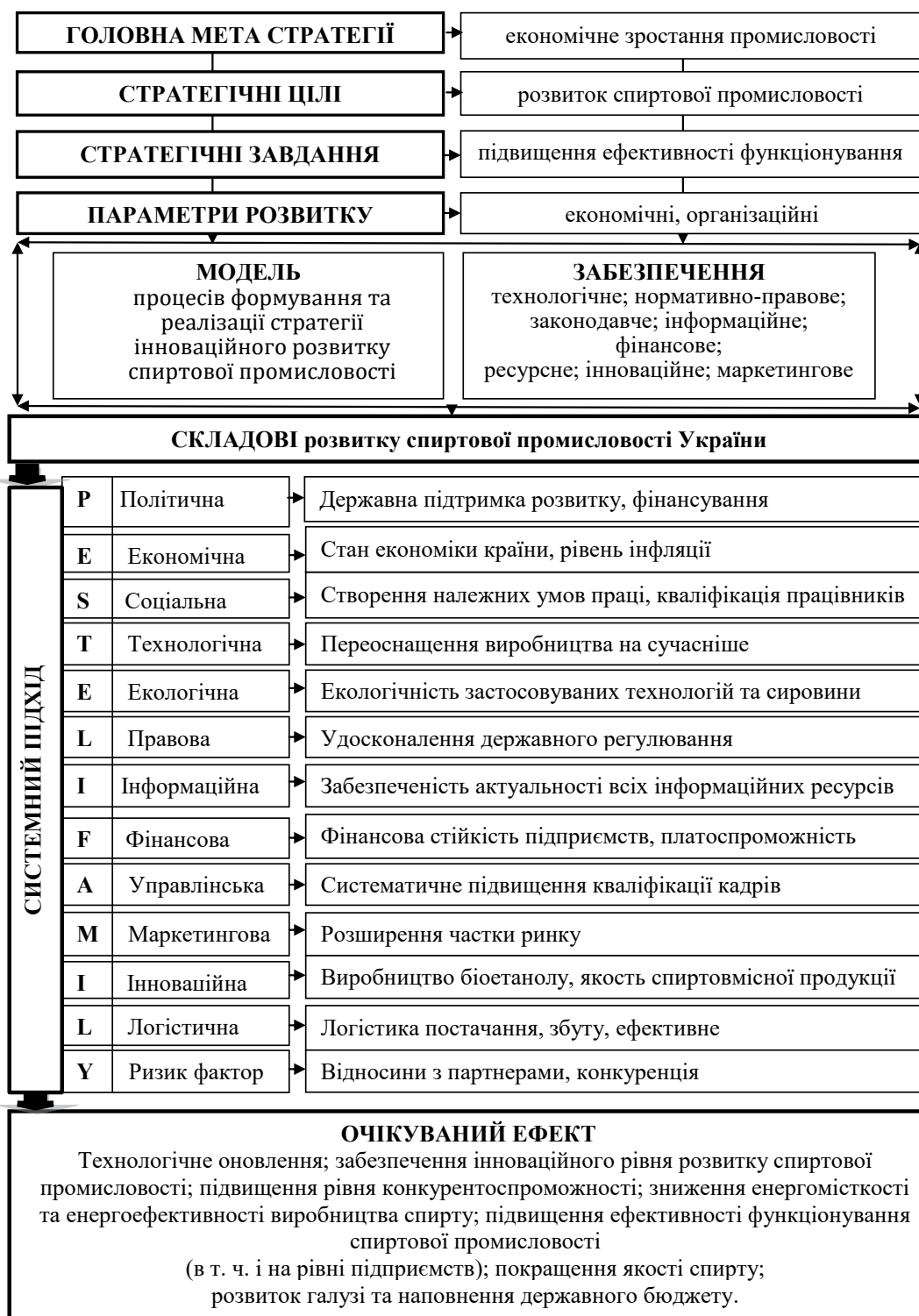
Рис. 3. Концептуальна модель інноваційного розвитку спиртової промисловості