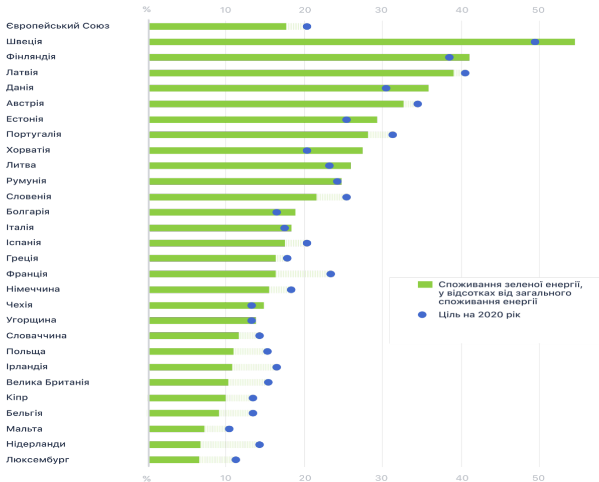
Рис. 1. Розподіл споживання відновлювальних джерел енергії у ЄС за країнами, 2018 р., % від загального енергетичного балансу