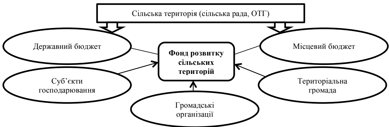
Рис. 1. Джерела фінансування розвитку сільських територій

«Фінанси мають бути там, де формуються та вирішуються проблеми – на місцях» - такої точки зору, як основної причини необхідності децентралізації, дотримується сучасні фінансисти-науковці. Особлива роль в системі джерел фінансового забезпечення розвитку сільських територій на місцях відводиться місцевим бюджетам (рис.1).