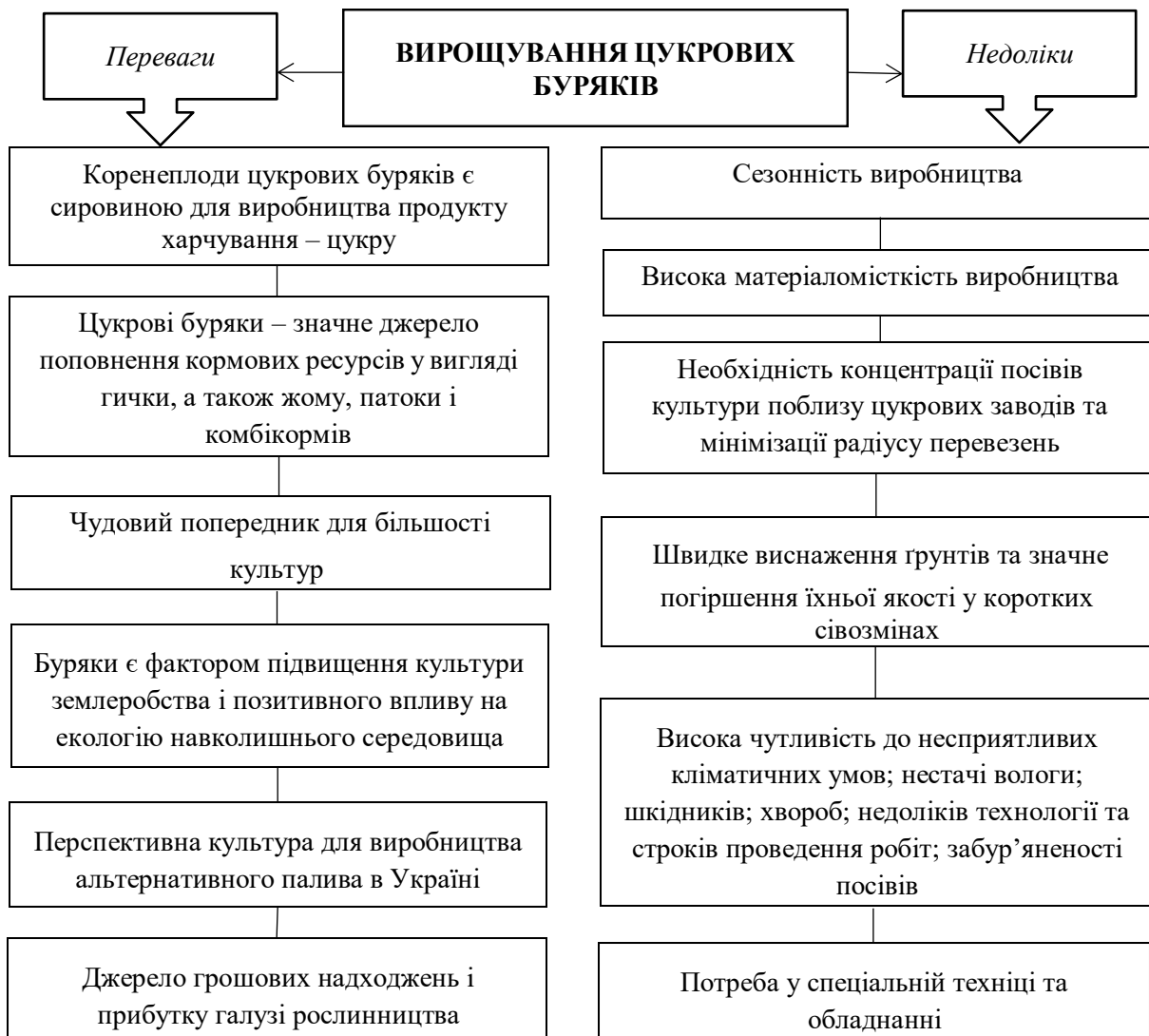
Рис. 1. Переваги та недоліки вирощування цукрових буряків

Вирощування цукрових буряків в Україні, як і все сільське господарство, – це високо ризиковане виробництво, яке має свої переваги та недоліки (рис.1).