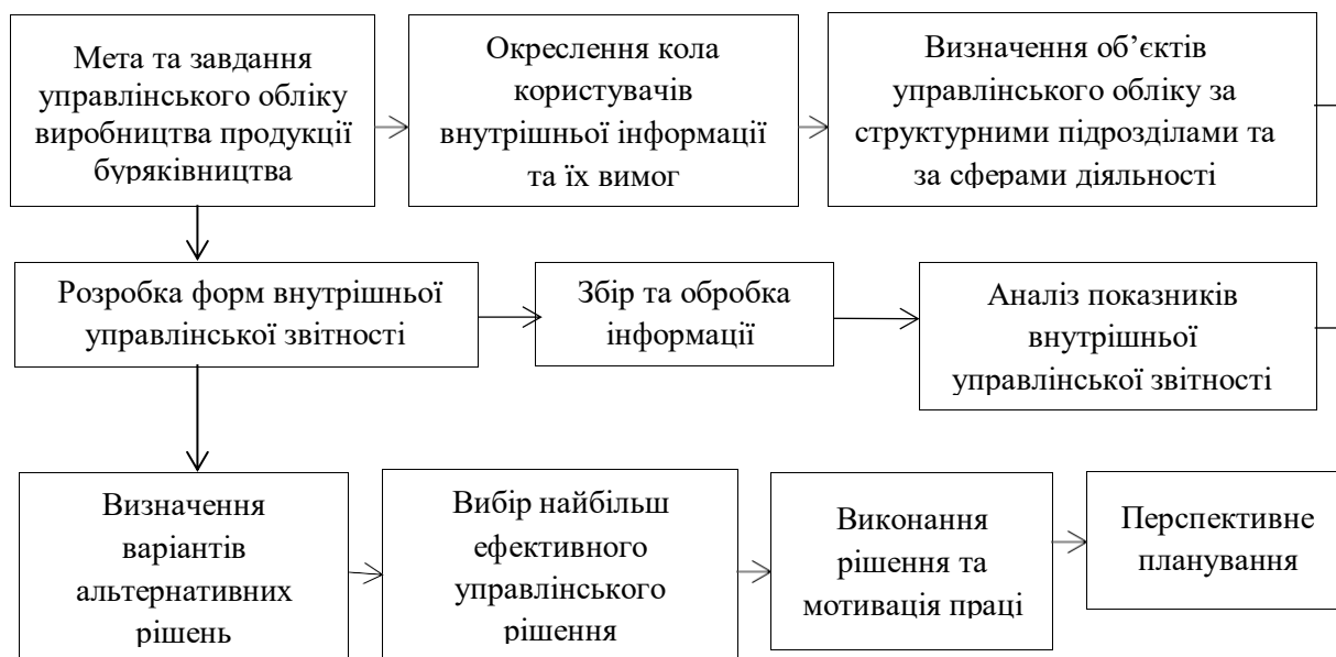
Рис. 4. Управління виробництвом продукції буряківництва підприємств мережі ІБКіЦБ НААН через систему впровадження управлінського обліку