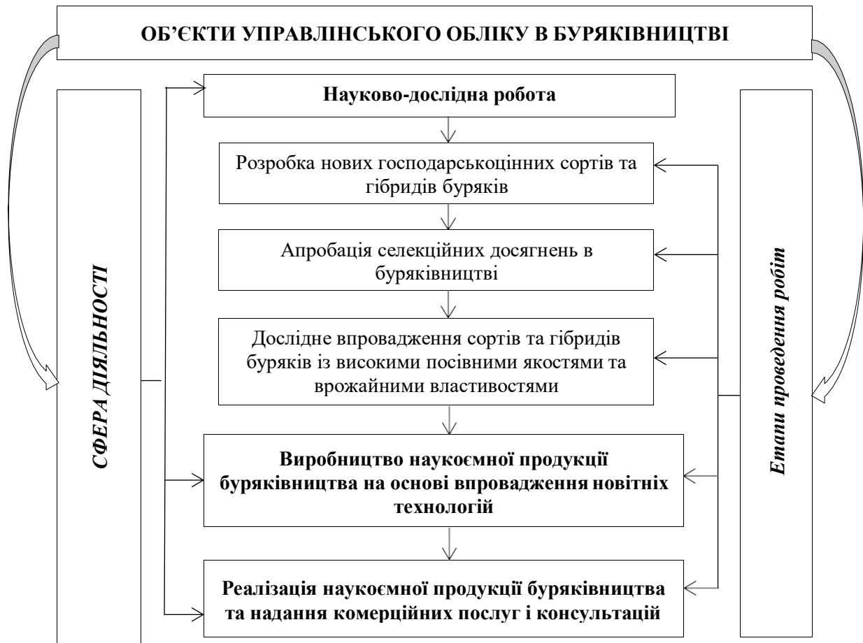
Рис. 5. Групування об'єктів управлінського обліку в буряківництві за сферами діяльності та за етапами проведення робіт установ та підприємств мережі ІБКіЦБ НААН