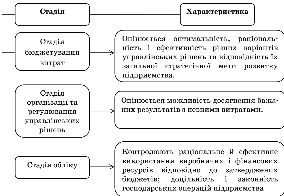
Рис. 3. Стадії внутрішнього контролю витрат підприємства

Висновки і перспективи подальших досліджень. Отже, ефективна система організації обліку та контролю матеріальних витрат будь-якого сільськогосподарського підприємства визначає необхідність налагодження функціональних обов'язків працівників, документообороту, статей калькуляцій в підсистемах економічної інформації. Цього можна досягти шляхом розробки внутрішніх стандартів контролю, удосконалення нормативно-правової бази стосовно організації обліку та внутрішнього контролю, а також доцільно було б на сільськогосподарських підприємствах ввести посаду внутрішнього аудитора, який би здійснював посилені контрольні функції за матеріальними витратами. Це дасть змогу отримати максимум достовірної та своєчасної інформації для користувачів в найбільш прийнятному вигляді.