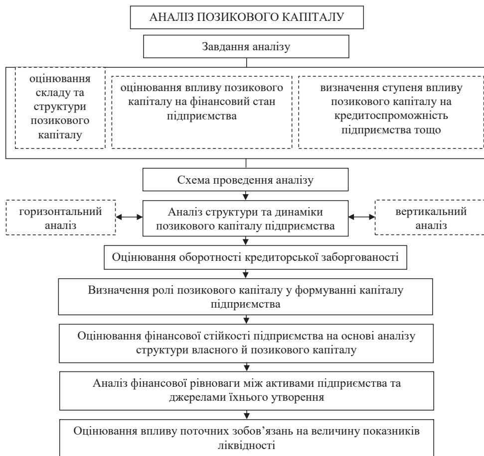
Рис. 1. Структурно-логічна модель послідовності здійснення аналізу позикового капіталу

Оцінювання структури та динаміки позикового капіталу здійснюють за допомогою методичного прийому порівняння. Головними видами порівняльного аналізу є вертикальний та горизонтальний [2, с. 54]. Вертикальний аналіз дає змогу визначити вагову частку кожного виду позикового капіталу у загальному підсумку. Також цей вид аналізу дає можливість перевірити повноту й правильність розрахунку впливу окремих факторів на зміну загальної суми позикового капіталу. Завжди підсумок впливу всіх факторів має дорівнювати величині загального відхилення позикового капіталу. Горизонтальний аналіз дає змогу визначити абсолютні та відносні відхилення окремих видів позикового капіталу у звітному періоді порівняно з попереднім, а також оцінити їхнє значення на перспективу. Спільною ознакою вертикального та горизонтального аналізу є використання відносних