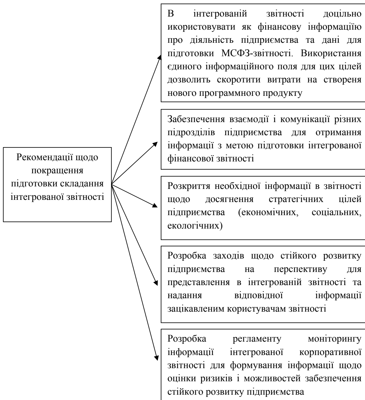
Рис. 3. Рекомендації щодо покращення складання інтегрованої звітності