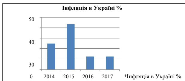
Рис. 1. Інфляція (споживчі ціни) в Україні з 2014 по 2017 р. [3]

Під час діагностики можливе використання рівних методів, що розширить межі дослідження. Осно-