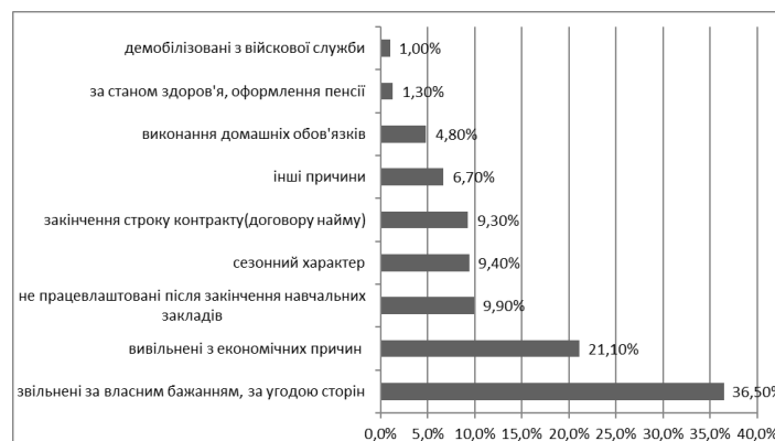
Рис. 1. Структура безробітного населення в Україні станом на 1.01.2019 за причинами незайнятості [побудовано за [8]]