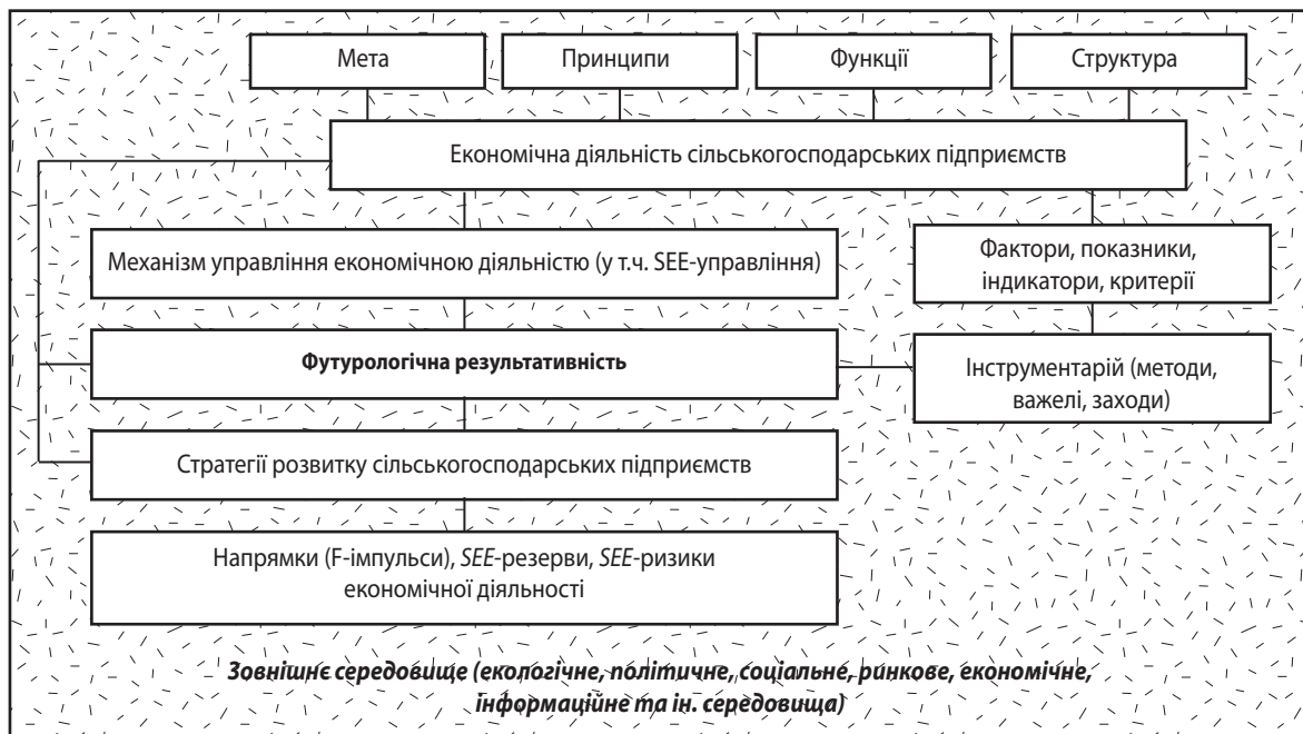
Рис. 2. Механізм економічної діяльності сільськогосподарських підприємств

спрозрахунок, фінансування, умови реалізації продукції, виробничо-технічне обслуговування, умови господарювання, різні ліміти, собівартість продукції, рентабельність