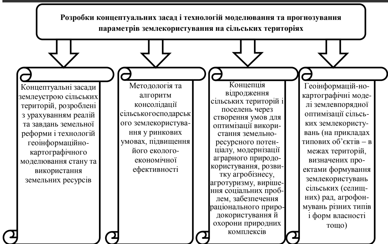
Рис. 2. Розробки концептуальних засад і технологій моделювання та прогнозування параметрів землекористування на сільських територіях