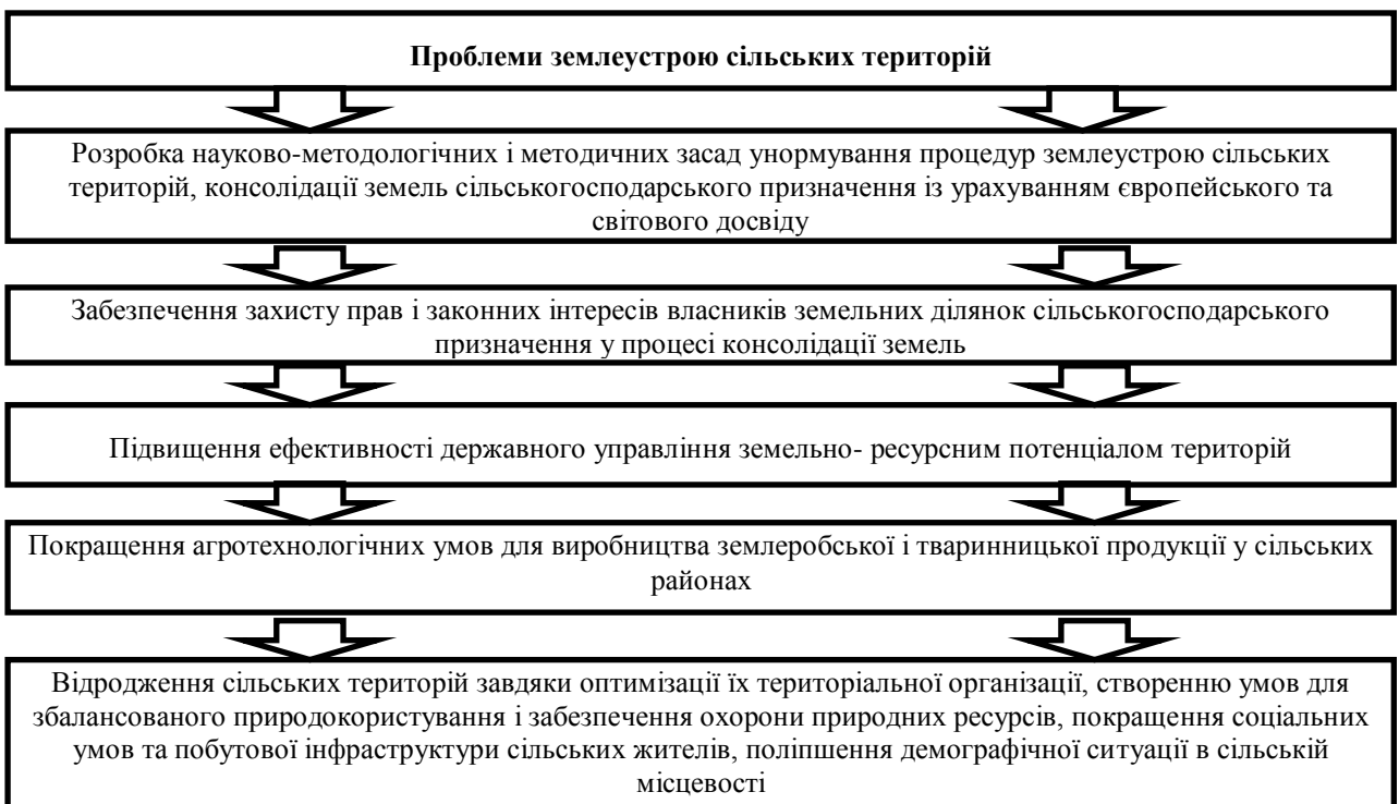
Рис. 1. Актуальні проблеми землеустрою сільських територій

Трансформаційні процеси в сільській місцевості України обумовлені широким колом факторів – погіршенням демографічної, соціальної, екологічної та економічної ситуації, неефективною сільськогосподарською та земельною реформою. Серед них можна виділити проблеми сільського землеустрою (рис. 1).