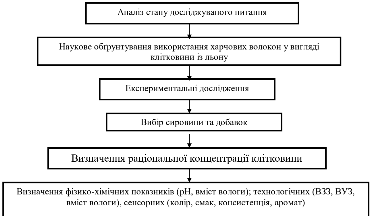
Рис. 1. Схема напрямку досліджень

Результати досліджень. При створенні нових видів м'ясних продуктів необхідно розробити такі рецептури з використанням комбінацій рослинних і тваринних білків, які б найбільшою мірою відповідали вимогам, що пред'являються до сучасних продуктів з урахуванням традиційно звичних для споживача органолептичних показників продукту, одночасно знижуючи витрати м'ясної сировини. У розроблених нових видах м'ясних напівфабрикатів при частковій заміні м'ясної сировини рослинними інгредієнтами необхідною умовою є збереження органолептичних показників, котрі відповідають традиційним.