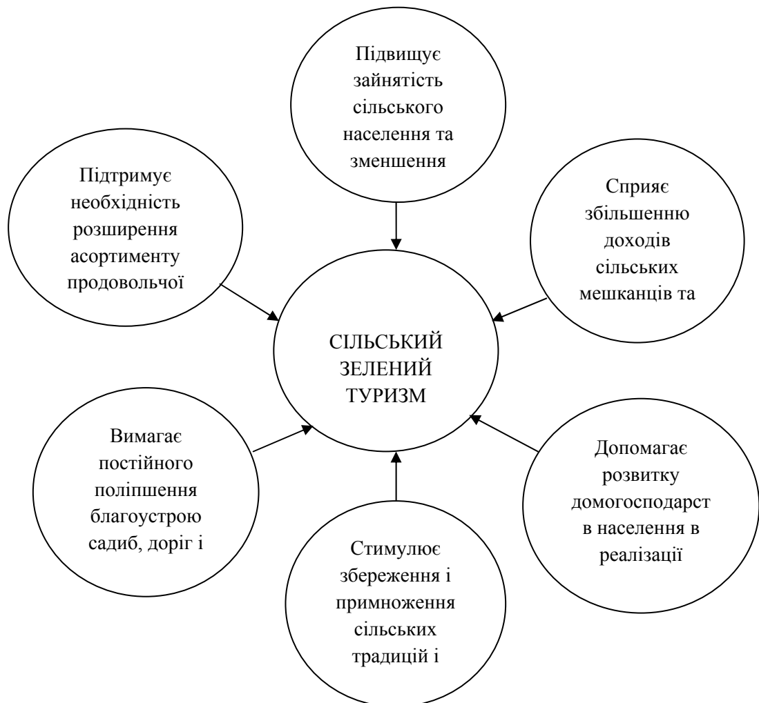
Рис. 1. Фрагментація ролі сільського зеленого туризму у вирішенні проблем села