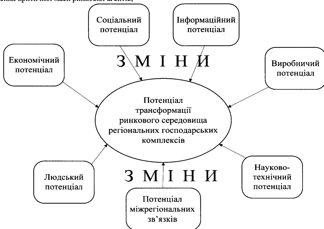
Рис. 2 Схема синергетичного впливу ринкових потенціалів на трансформації регіональних господарських комплексів

Усі визначення питання щодо дослідження ринкового потенціалу не мають реального теоретичного обґрунтування та методологічного визначення у системі української регіональної економіки та практичної апробації в межах українського регіонального менеджменту. Підходи до оцінки розвитку регіональної економіки залишаються неринковими. Вони не є аргументованими з позиції таких первинних категорій як попит, пропозиція, регіональні галузеві ринки, ємність ринку, кореляція ринкових утворень, агломерація ринкових процесів, асиметрія розвитку ринків та інші. Ці питання розглядаються вітчизняними науковцями як теоретичні процеси, а світова ринкова економіка орієнтує свою дослідну діяльність на рівні теорії, аналітичних досліджень, методології, управлінського інструментарію впровадження та контролю (рис. 2).