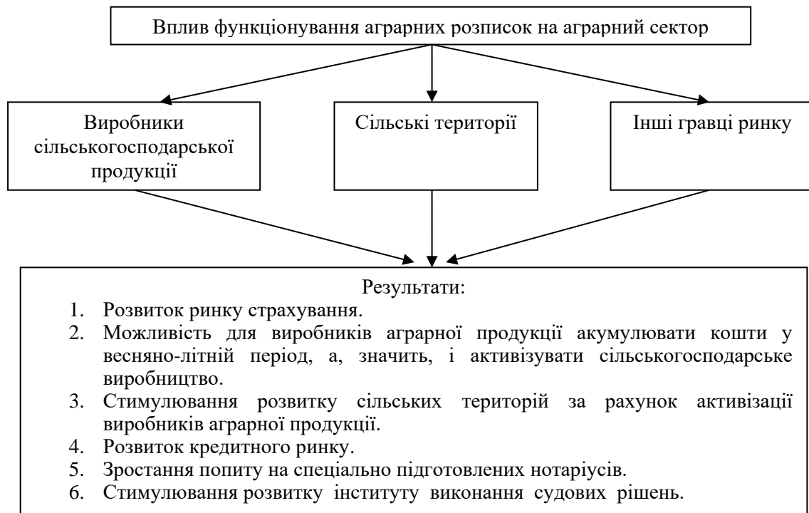
Рис. 3. Вплив функціонування аграрних розписок на суб'єкти ринку

Дослідження сучасного стану розповсюдження аграрних розписок в Україні дозволяє визначити їх, як ефективний та сучасний інструмент фінансування аграрних товаровиробників, загальні переваги якого сформулюємо на рис. 3.