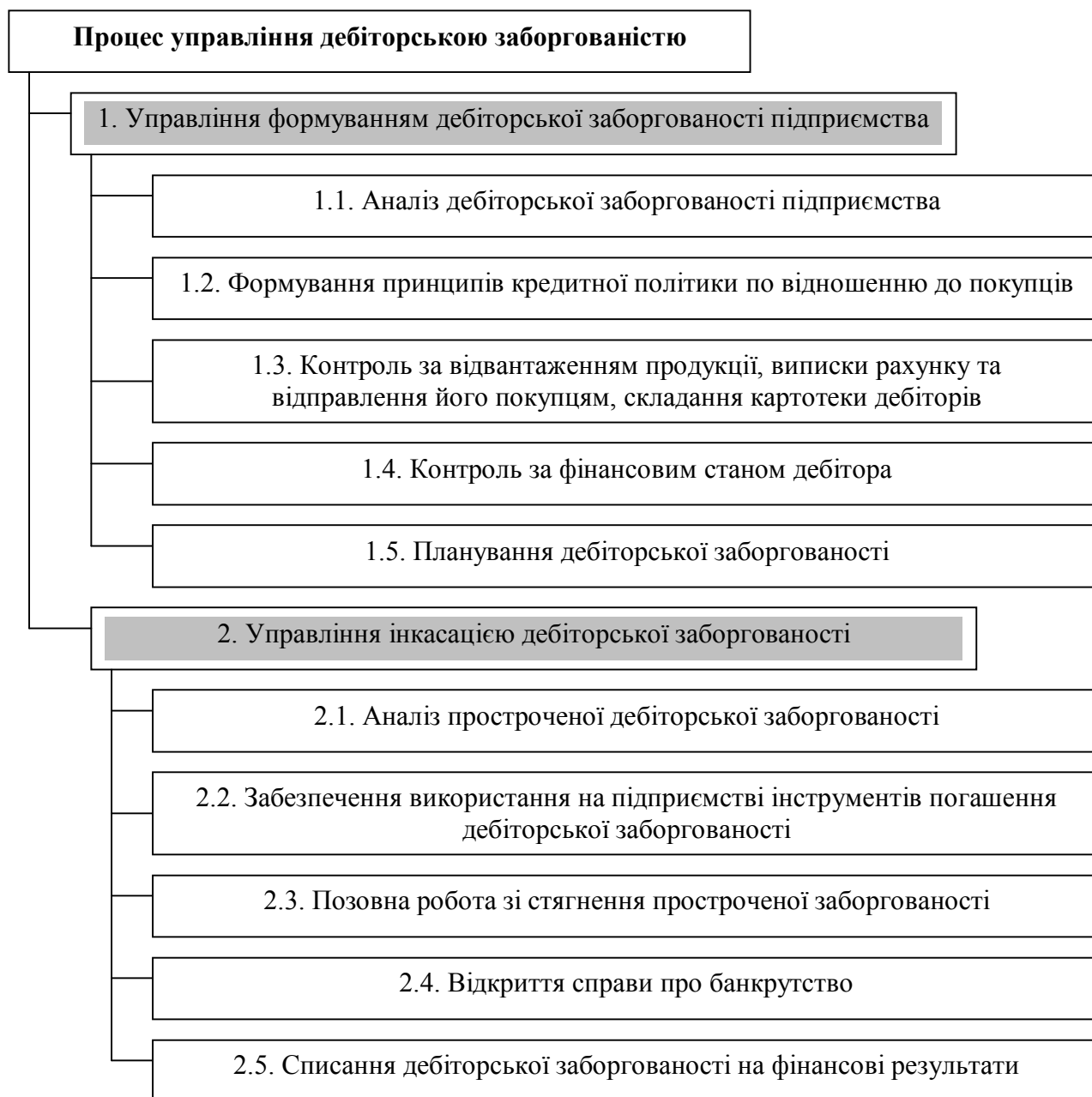
Рис. 1. Структурно-логічна модель процесу управління дебіторською заборгованістю [6]

Зміст та основна мета управління дебіторською заборгованістю – максимізація прибутку підприємства шляхом управління процесами формування та інкасації дебіторської заборгованості (рис. 1).