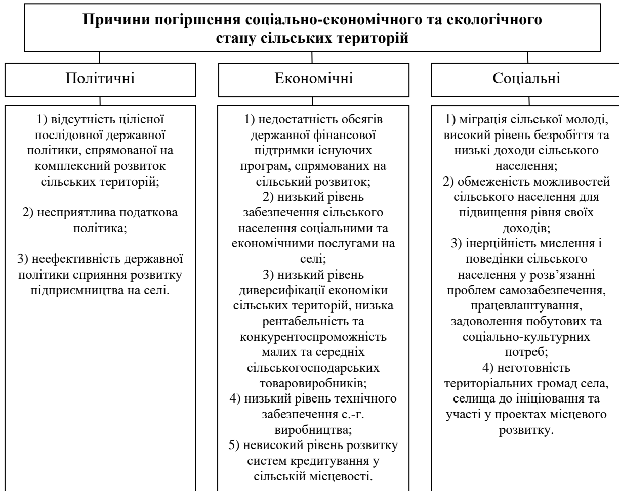
Рис. 1. Причини погіршення соціально-економічного та екологічного стану сільських територій