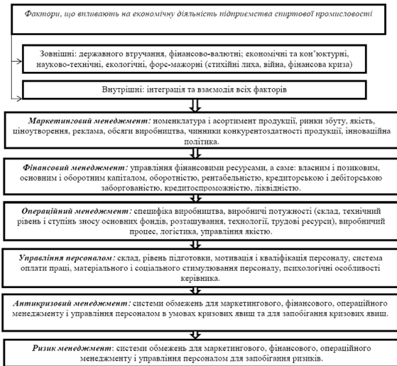
Рис. 1. Фактори впливу на економічну ефективність діяльності підприємств спиртової промисловості

Для системного підходу характерна комплексна оцінка впливу різнопланових факторів, цільовий підхід до їхнього вивчення. Тоді фактори економічної ефективності діяльності підприємств спиртової галузі можна представити наступним чином (рис. 1). При визначенні факторів впливу на економічну ефективність діяльності підприємств спиртової промисловості потрібно розглядати не самі ресурси і рівень їх використання, а систему управління цими ресурсами відповідно до поставленої стратегічної мети. Знання факторів виробництва, вміння визначити їхній вплив на показники ефективності дозволяють впливати на рівень показників за допомогою управління факторами, створити механізм пошуку резервів [2, с. 69].