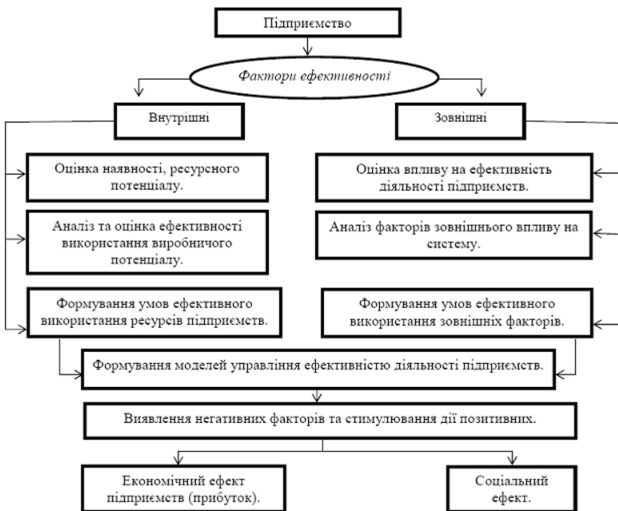
Рис. 2. Механізм реалізації шляхів підвищення ефективності діяльності підприємств спиртової промисловості