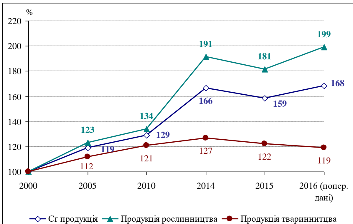
Рис.1. Приріст виробництва валової продукції сільського господарства в Україні, у % до 2000 року

Виклад основного матеріалу дослідження. У результаті здійснення земельної реформи відбулися значні зміни в організації та діяльності агропромислового комплексу України, що призвело до реформування аграрних відносин на селі. Було реформовано 11956 сільськогосподарських підприємств. На новій організаційно-правовій основі сформовані підприємства ринкового спрямування. Однак сподівання на швидке формування ефективних власників, зацікавлених і спроможних раціонально використовувати сільськогосподарські угіддя, гальмувалось рядом неврегульованих питань правового, організаційного, економічного характеру [1].