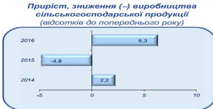
Рис. 3. Приріст (зниження) виробництва сільськогосподарської продукції за 2014–2016 рр. в Україні [8]