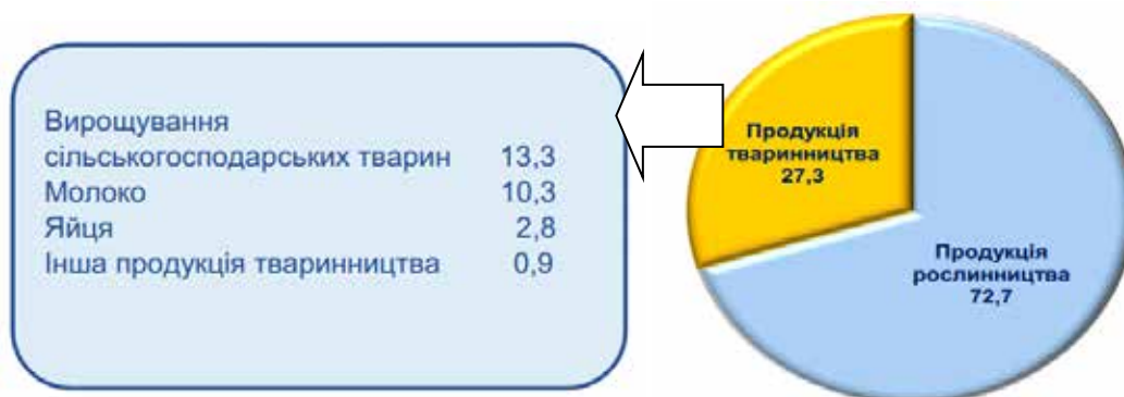
Рис. 2. Структура продукції сільського господарства України за 2016 р., % [8]

Виробництво в 2014 р. збільшилося на 2,2% порівняно з 2013 р., у 2015 р. спостерігалось різке зниження (-4,8%), у 2016 р. відбулося збільшення на 6,3% порівняно з 2015 р. Причинами такої ситуації є: зміна законодавства; інфляційні про-