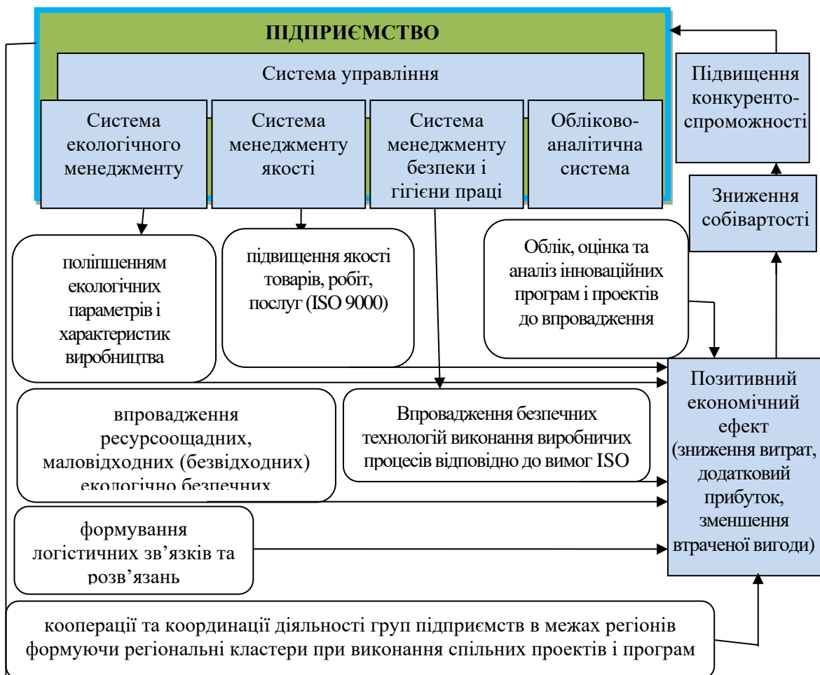
Рис. 1. Механізм підвищення конкурентоспроможності підприємств на вітчизняному та міжнародному ринках

Реалізація таких ініціатив, заснованих на дотриманні принципів на зразок функціонування найбільш перспективних світових кластерів, дасть можливість сільськогосподарським підприємствам України працювати в напрямку постійного поліпшення із наступним розширенням партнерських стосунків на міжнародному ринку. Вихід підприємств на міжнародні ринки торгівлі є можливим лише при дотриманні встановлених ними вимог та правил (сертифікації якості продукції, сертифікації виробничого процесу та ін.). Однією із важливих вимог є відповідність нормам екологічної безпеки, показникам якості продукції, що ними виробляється й в подальшому реалізується. Рівень відповідності вимогам визначається та регулюється міжнародними стандартами серії ISO 9000, ISO 14000 та ін. Досягти реалізації на підприємстві виконання визначених параметрів можливо лише при впровадженні інновацій, зорієнтованих на високий рівень екологічності та економічної ефективності (так званих екологічних інновацій), що забезпечить гідне місце підприємствам України та їхній продукції, товарам, роботам, послугам на міжнародному ринку. Нами розроблено механізм підвищення конкурентоспроможності підприємств на вітчизняному та міжнародному ринках (рис. 1).