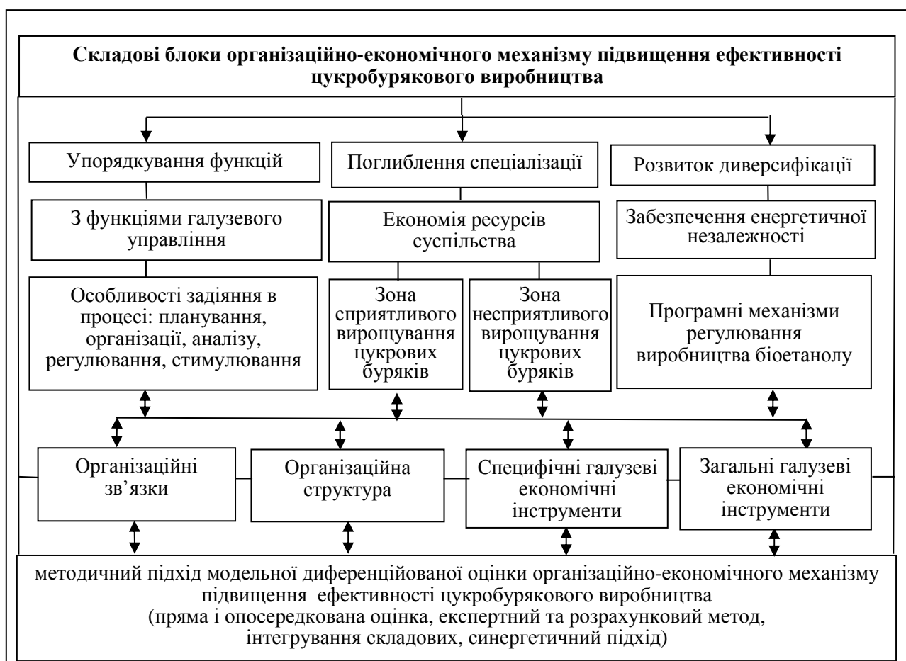
Рис. 2. Організаційно-економічний механізм підвищення ефективності цукробурякового виробництва

Організаційно-економічний механізм підвищення ефективності цукробурякового виробництва зумовлює необхідність узгодження його функцій з функціями системи управління при їх спрямуванні на досягнення цілей галузевого розвитку, з урахуванням на етапі планування сукупності впливів його організаційної та економічної складових. При цьому доцільним є обґрунтування готовності приймати альтернативні рішення в результаті зміни впливу зовнішнього середовища. При проведенні організаційних заходів важливим є порядок задіяння складових механізму на раціональне здійснення виробничих процесів і суб’єктів господарювання галузі (рис. 2).